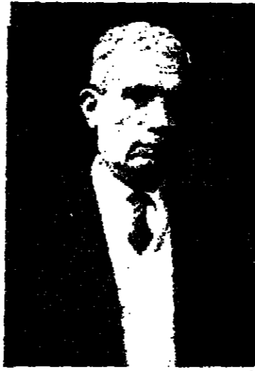
رجب السراج مدير عام دائرة التجارة والصناعة في قطاع غزة